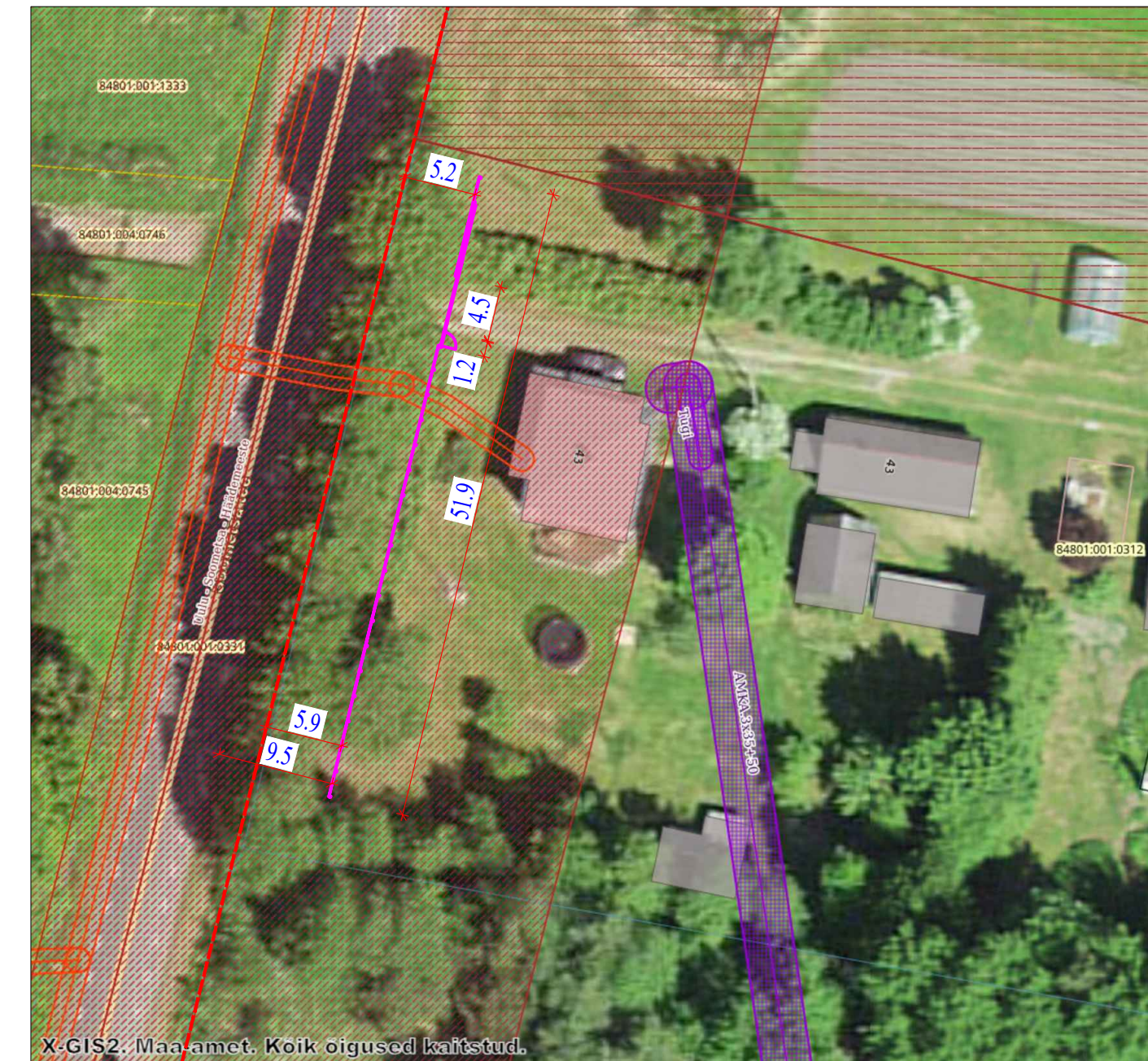
NB! ALUS VÕETUD MAA-AMETI LEHELT